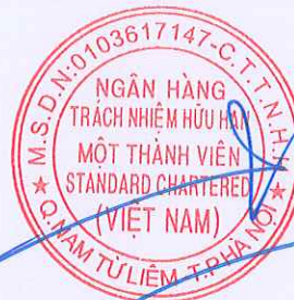
VŨ HƯƠNG GIANG Phó phòng nghiệp vụ dịch vụ chứng khoán