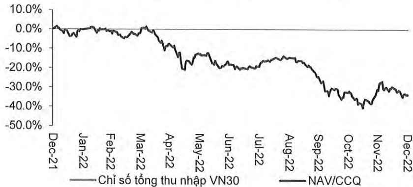
Biểu đồ thể hiện kết quả đầu tư của Quỹ so với chỉ số tham chiếu trong năm 2022