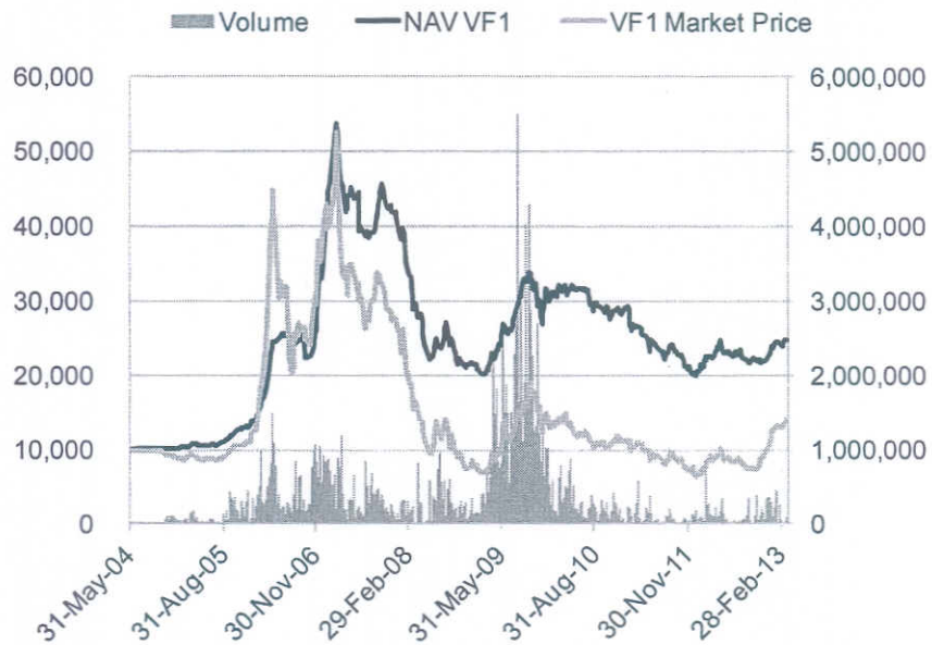
Đồ thị biến động tỷ lệ chiết khấu