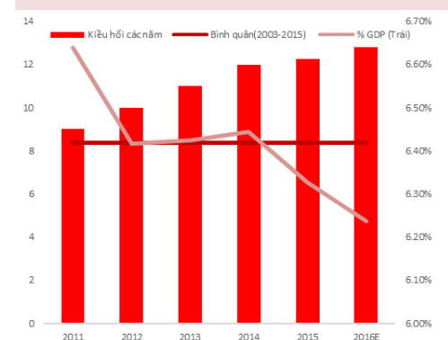
KIỀU HỐI VÀ SỬ DỤNG KIỀU HỐI